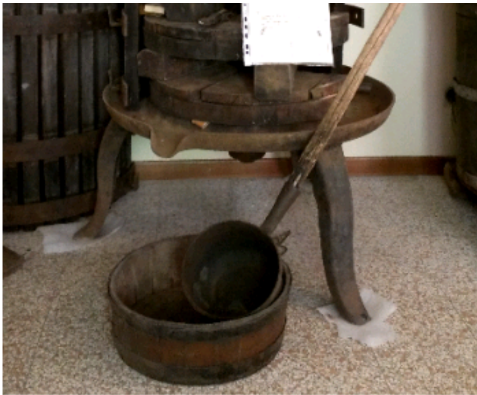
winex museo del vino e della produzione vinicola italiana

multidisciplinare, per scoprire non solo i dettagli tecnici – l'esame visivo, olfattivo e gustativo – ma anche in prospettiva storica, dalle origini del vino degli etruschi, romani e attraversando la Firenze medievale. E ancora, in una carrellata di elementi che orbitano intorno al bicchiere: la vigna, il mondo del sommelier e i vini biologici.